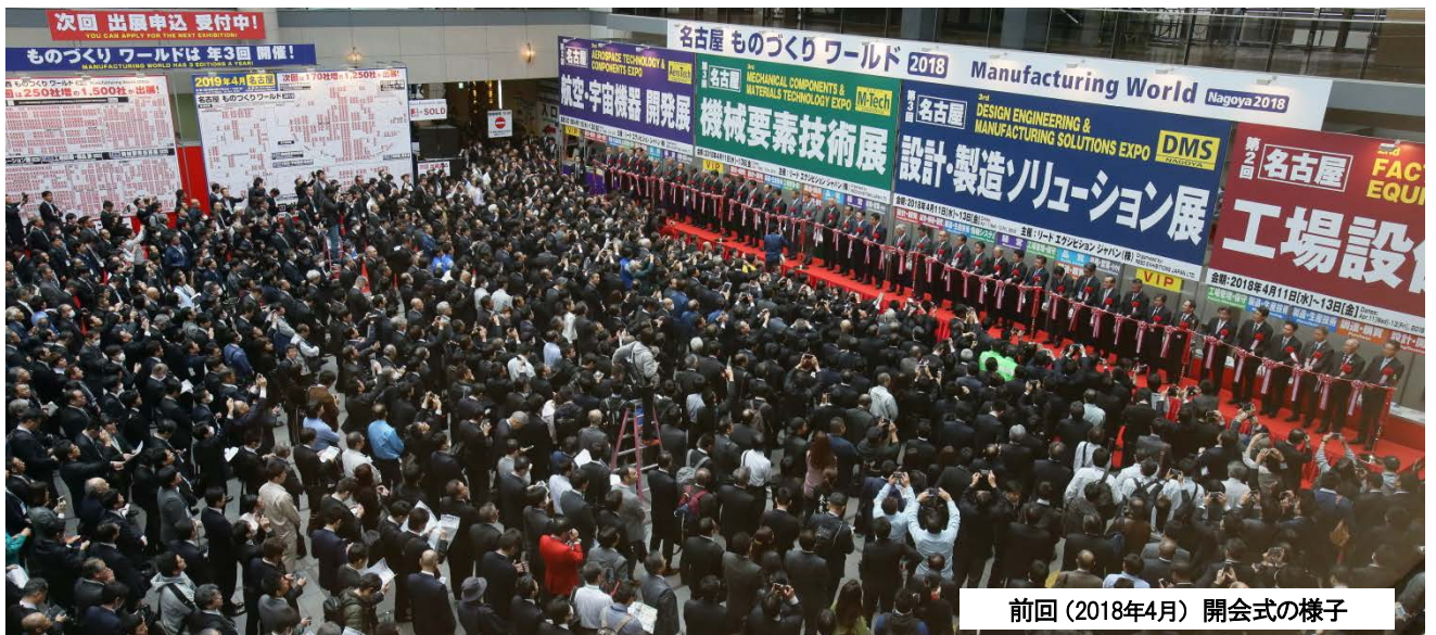
前回(2018年4月) 開会式の様子

取材の申込みはこちら ▶▶ https://www.japan-mfg-nagoya.jp/shuzai/