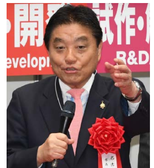
河村たかし 名古屋市長